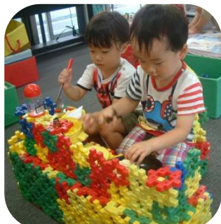
ブロックで台所を 作って、お料理♪