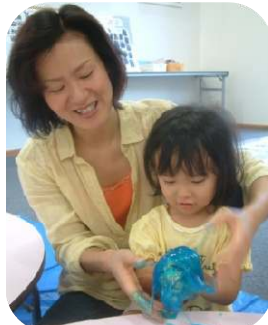
2歳児以上親子のつどい☆スライム作り