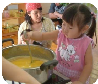
☆エプロンくらぶ☆ チキンライスとかぼちゃのポタージュを作りました。