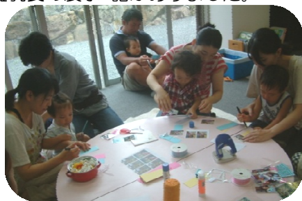
敬老の日のプレゼント作りで 顔写真入りのしおりを作りました！