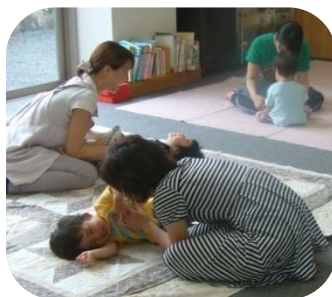
♪わらべうたのつどい♪ わらべうた歌ったで賞の表彰式がありました！