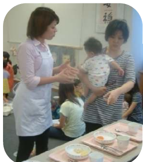
☆0歳児親子のつどい☆ 離乳食の展示・話がありました。

澄みきった青空や朝夕の風の冷たさに、秋の深まりを感じるようになりました。戸外にでると、木の実や落ち葉がたくさん！季節の変化を一緒に見つけに出かけましょう。