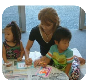
クレパスで作品作り