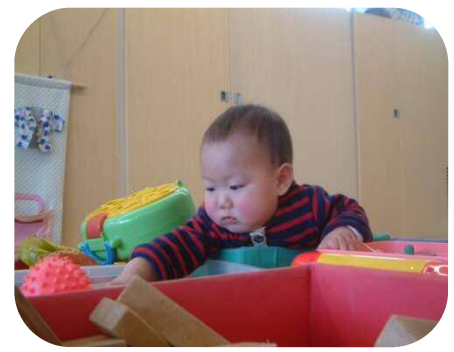
《メープル広場での様子♪》 おもちゃでのんびり遊んだり、皆で食べる ごはんって美味しいな～ ☺