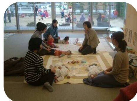
《0歳児親子のつどい》 助産師さんへの育児相談・身体測定