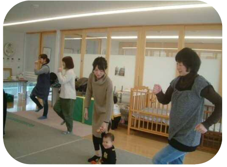
《1歳児以上わらべうたのつどい》 身体を動かして楽しみました♪