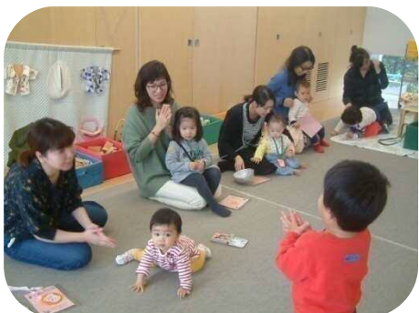
《☆12月生まれのお誕生会☆》 大型絵本の読み聞かせ・お友達の歌のプレゼントもありました！