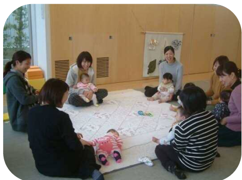
《☆0歳児親子のつどい☆》