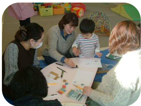
《消しゴムはんこ作り》 出来上がった作品とハイ、チーズ☆

寒いが続いてますね。インフルエンザや風邪にかかる子供達も増えてくる時期になりました。体調管理に気をつけ、この冬を元気に乗り切りましょう！今月は豆まきがあります。メープル広場にも鬼がやって来ますので、みんなで豆をまいて、鬼を退治しましょう！