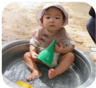
晴れた日の水遊びは 気持ちがいいね♡