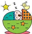
プレパパ プレママ学級