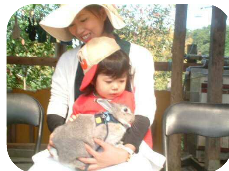
ウサギも抱っこしたよ