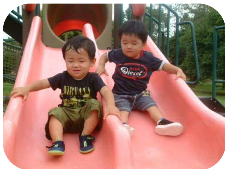
《金魚と鯉の郷広場》 すべり台楽しいな！ みんなでいただきま〜す(^o^)