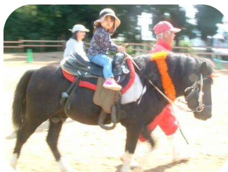
《立願寺ポニー公園》 お馬さんに一人でも乗れるよ