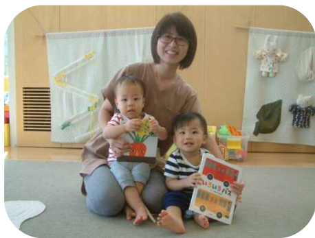
《絵本の読み聞かせ》 2冊の楽しい絵本を 紹介していただきました♪

少しずつ吹く風が冷たくなってきました。季節の移り変わりを感じますね。戸外は色づいた葉や木の実がいっぱい！自然とふれあいながらたくさん遊びましょう♪