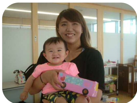
《バス作り》 牛乳パックを使って かわいいバスを作りました