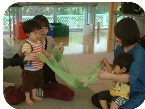
《1歳以上わらべうた》