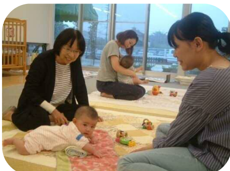
《0歳児親子のつどい》 助産師さんへの育児相談・身体測定