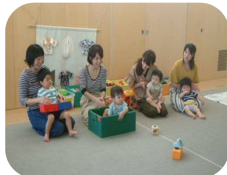
《9月生まれのお誕生会☆》