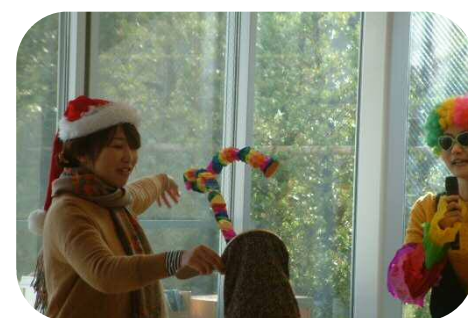
ママ達のマジックにみんなびっくり