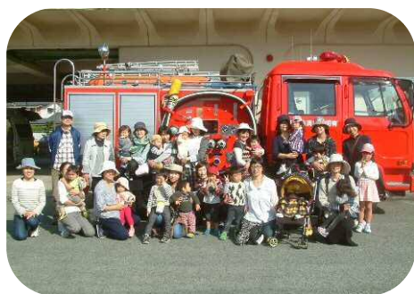
消防自動車や救急車の見学

玉名市子育てネットワークは、おかげさまで23度目の春を迎えます。 メープル広場が、これからもたくさんの方との出会いや、つながりの出来る場として利用していただけ たら嬉しいです。