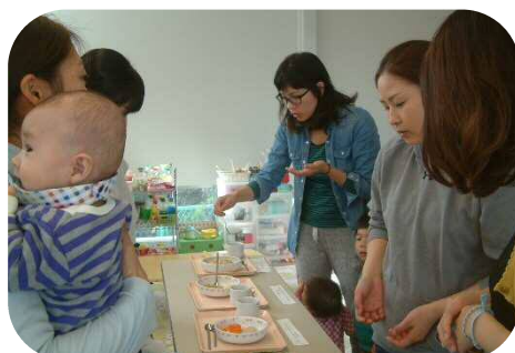
0歳児親子のつどい☆離乳食