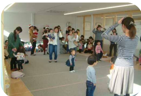
☆お楽しみ会盛り上がりましたね～☆