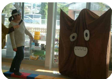
方言で『6匹のやぎのがらがらどん』 の劇。迫力がありました！