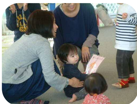
11月生まれのお誕生会♪手形をとって、エプロンシアターもみました。