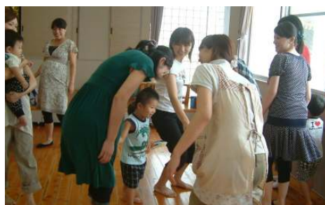
☆わらべうたのつどい☆ 親子でわらべうた遊びを楽しみました。