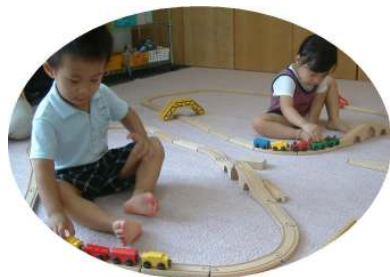
☆電車で遊ぼう☆ 自由に線路を組み合わせて電車を走らせました！

風が心地よい季節になりましたね。園庭の木々も少しづつ色づきはじめました。読書の秋です。テレビを消してお子さんと一緒に絵本を楽しんでみませんか。秋の自然と一緒に見つけて、この季節ならではの遊びを楽しみましょう！