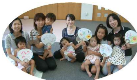
☆デンデン太鼓作り☆ うちわに貼り絵やクレヨンで絵を描いてオリジナルの太鼓を作りました！！