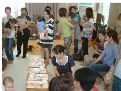
☆0歳児親子のつどい(離乳食)☆ 栄養士による離乳食の話があり、みなさん質問をされていました。