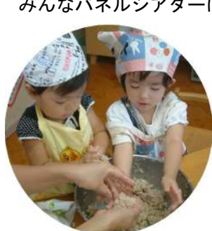
☆エプロンくらぶ☆ ライスバーグ・ライスバーガーなどを作りました！！