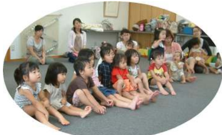
☆誕生会☆ みんなパネルシアターに夢中！！