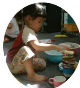
台所コーナー大好き☆ ドーナツタワーの出来上がり！