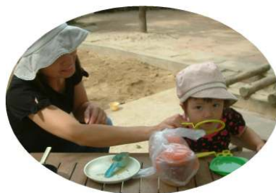
☆シャボン玉で遊ぼう☆ 上手にとばせるかな？